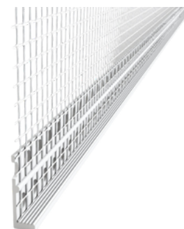
Profilo terminale in PVC con rete