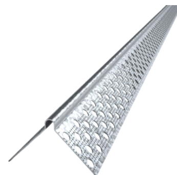
Paraspiangolo per cartongesso