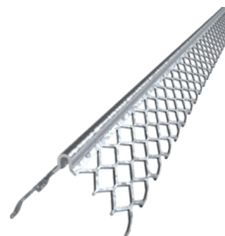
Paraspigolo 5 maglie

Profilo paraspiangolo a 5 maglie per intonaco. Rinforza gli angoli, migliora l'adesione e riduce il rischio di crepe. Ideale per applicazioni interne ed esterne.