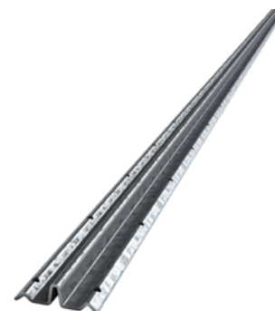
Guida a "T"

Profilo guida a "T" in acciaio zincato per intonaco. Garantisce allineamento, spessori uniformi e resistenza alla corrosione. Ideale per posa precisa e duratura.