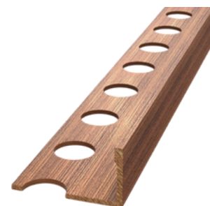
Spazzolato rame antico