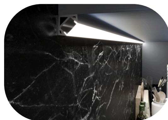
Esempio di installazione