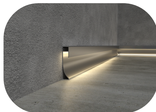
Esempio di installazione